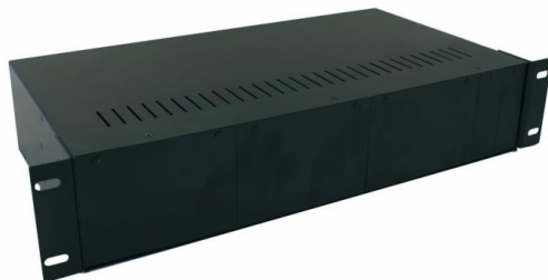
Рис.1 Бокс О-142В, внешний вид в закрытом состоянии