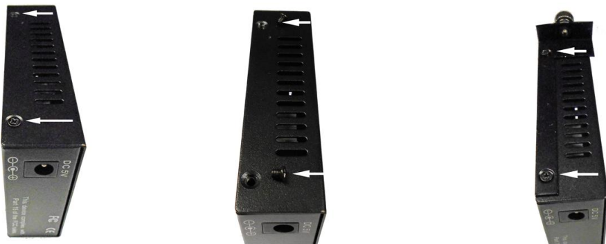
Рис. 4 Установка крепления под винт на корпус медиаконвертера